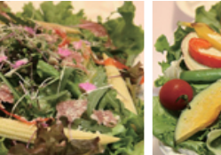
本気のバーニャカウダ