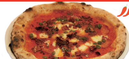
レッチリ / RedHotChillPeppers

(薫製モッツアレラ、ポルケッタ、ミラノサラミ、サルツッチャ、パルミジャーノ、ほうれん草、コジョウ) 衝撃の肉肉しさ。ボリューム満点の一枚!