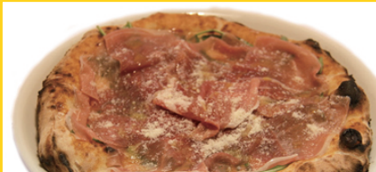
ピアンカ・ネーヴェ / Bianca Neve