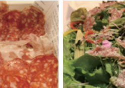
たっぷり野菜のミックスサラダ