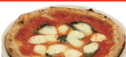
マルゲリータ エクストラ / Margherita Extra

(トマトソース、モッツアレラ、ソドゥイア辛コサラム、青唐辛子、唐辛子チップス) 辛いピザならレッチリ!