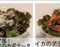
シチリア風! ナスのカポナータ