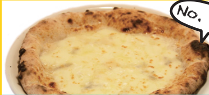
クアトロフォルマッジ / Quattro Formaggi

(生ハムのムース、スッキーニ、モッツアレラ、パプリカ) 語源はスプーン。サッカーマニアならわかるネーミング。