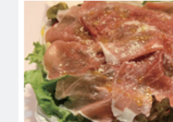
大人気! 切りたて生ハムのサラダ