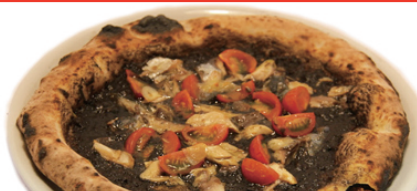
ブラック・サバス / Black Sabbath

(トマトソース、自家製ソーセージ、赤玉ねぎ) 自家製ソーセージのピザはピーターが多いです。