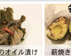
岩海苔のゼツポリーネ