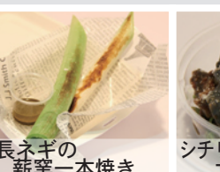
長ネギの新薫一本焼き