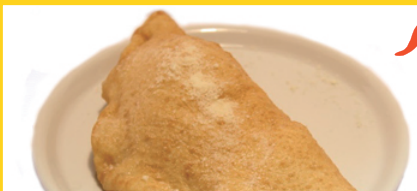
ピッツァフリッタ (揚げピッツァ) / Pizza Fritta

(薫製モッツアレラ、オレガノ、チェリートマト、バジル) 女王の名を持つシンプルながら味わい深いピザ。