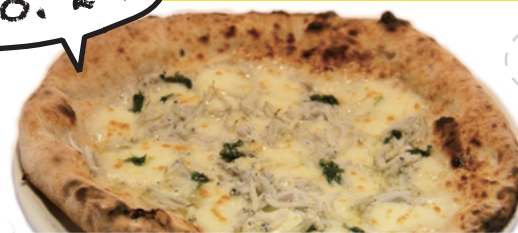
釜揚げシラスと青海苔/Bianchetti