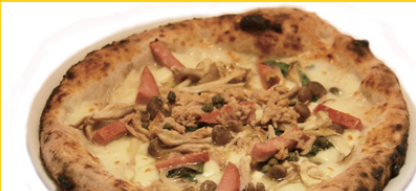
ボスカイオーラ(木こり風) / Boscaiola

(サンダニエーレ産生ハム、モッツアレラ、ルッコラ) 生ハム好きにはたまらないピザ。