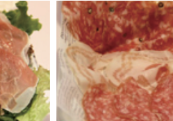
イタリアンサラミの盛り合わせ