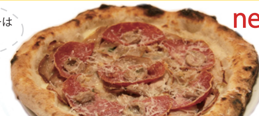
ゴッドファーザー/God father